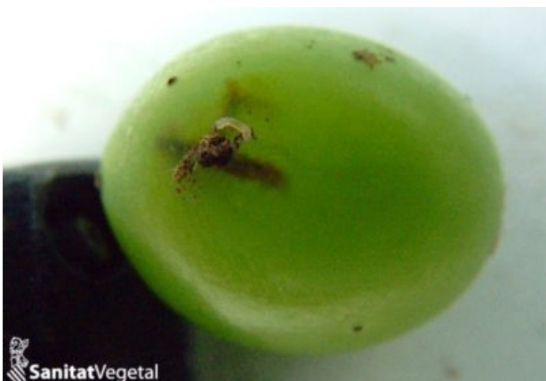
Daños de 2ª generación

Por todo ello, el Servicio de Sanidad Vegetal recomienda realizar un tratamiento insecticida para controlar esta plaga. Este tratamiento se realizará entre los días 19 y 23 de junio , ambos inclusive.