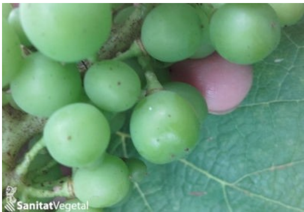
Huevo recién puesto

En esta semana se han detectado las puestas de las hembras adultas de esta 2ª generación. Dichas puestas se encuentran de manera muy irregular ya que se han observado niveles de puesta inferiores al 5% y en otras parcelas se han llegado a detectar hasta el 80% de racimos con puestas. En cualquier caso, predominan los huevos de color amarillo, los cuales, comenzarán su eclosión dentro de 3-5 días.